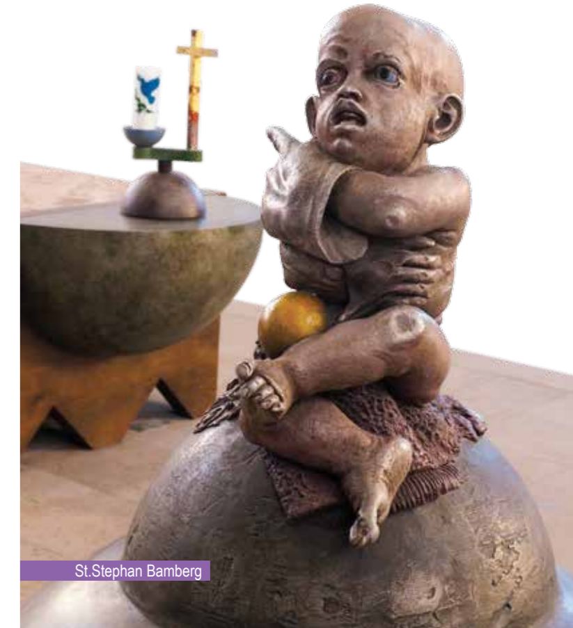
St. Stephan Bamberg